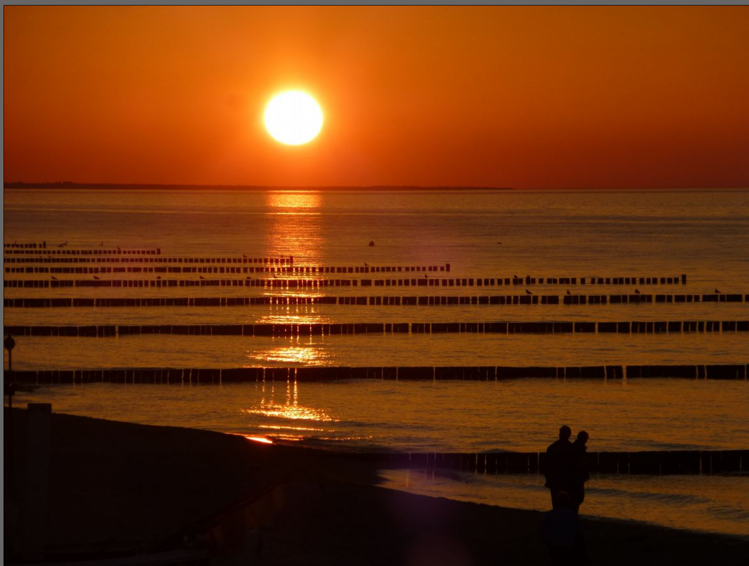
Koserow, Sonnenuntergang am Meer

Zwei Dinge sind unendlich: Das Universum und die menschliche Dummheit. Aber beim Universum bin ich mir nicht ganz sicher.