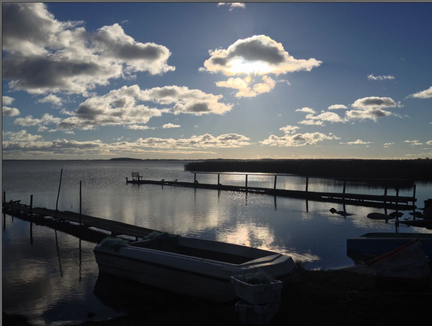
Neeberg an der Krumminer Wiek

Statt zu klagen, dass wir nicht alles haben, was wir wollen, sollten wir lieber dankbar sein, dass wir nicht alles bekommen, was wir verdienen.