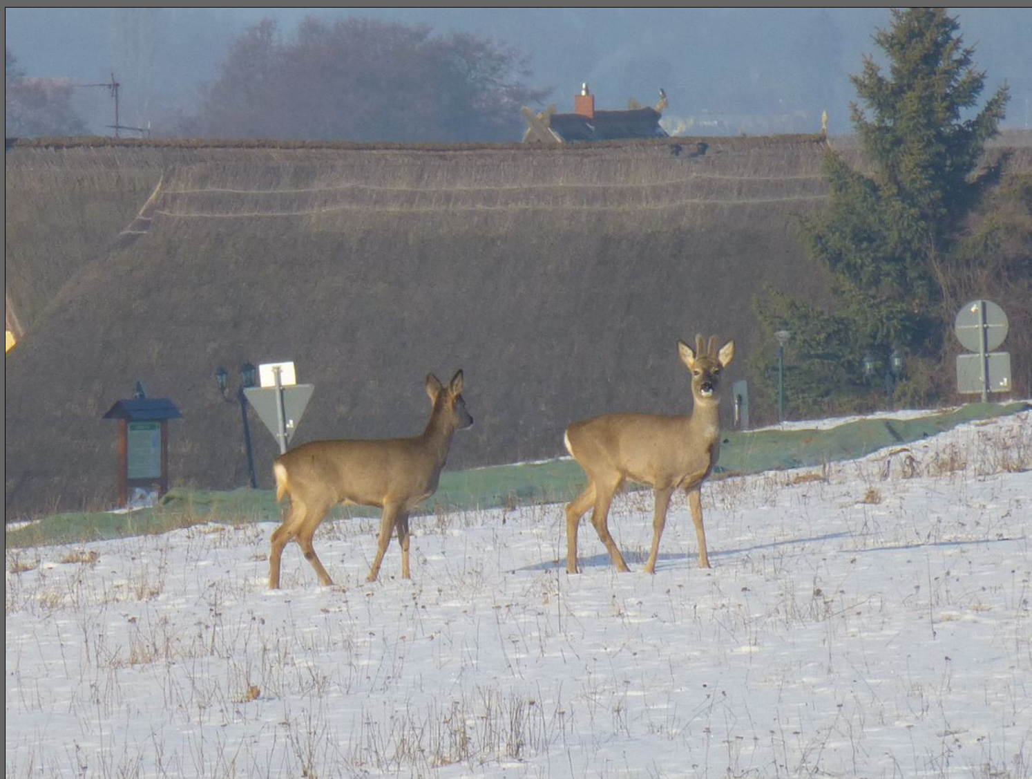
Rehe am Ortsrand von Loddin

Wer die Freiheit aufgibt, um Sicherheit zu gewinnen, wird am Ende beides verlieren.