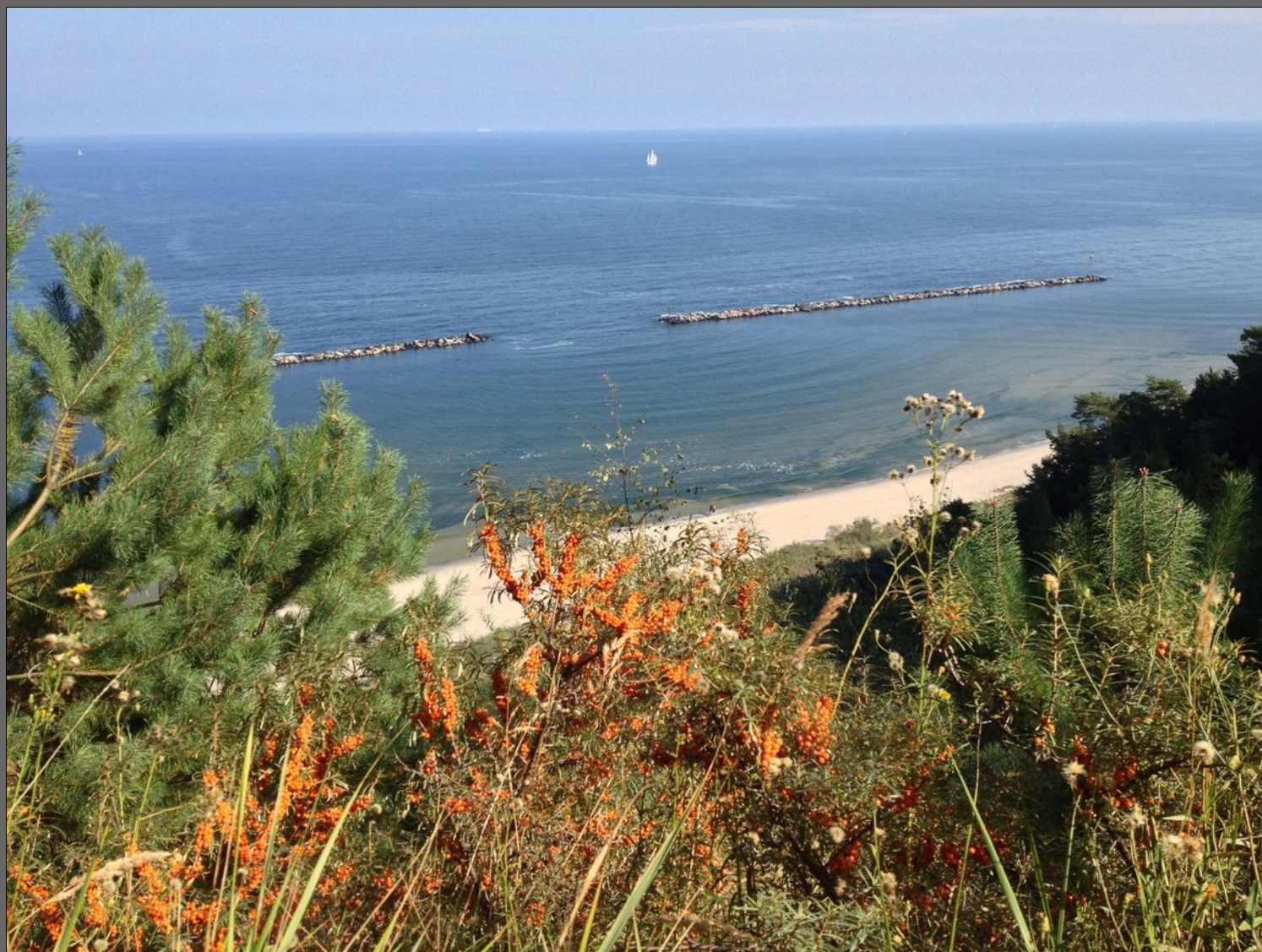
Blick vom Streckelsberg

Du siehst die Welt nicht so wie sie ist, du siehst die Welt so wie du bist.