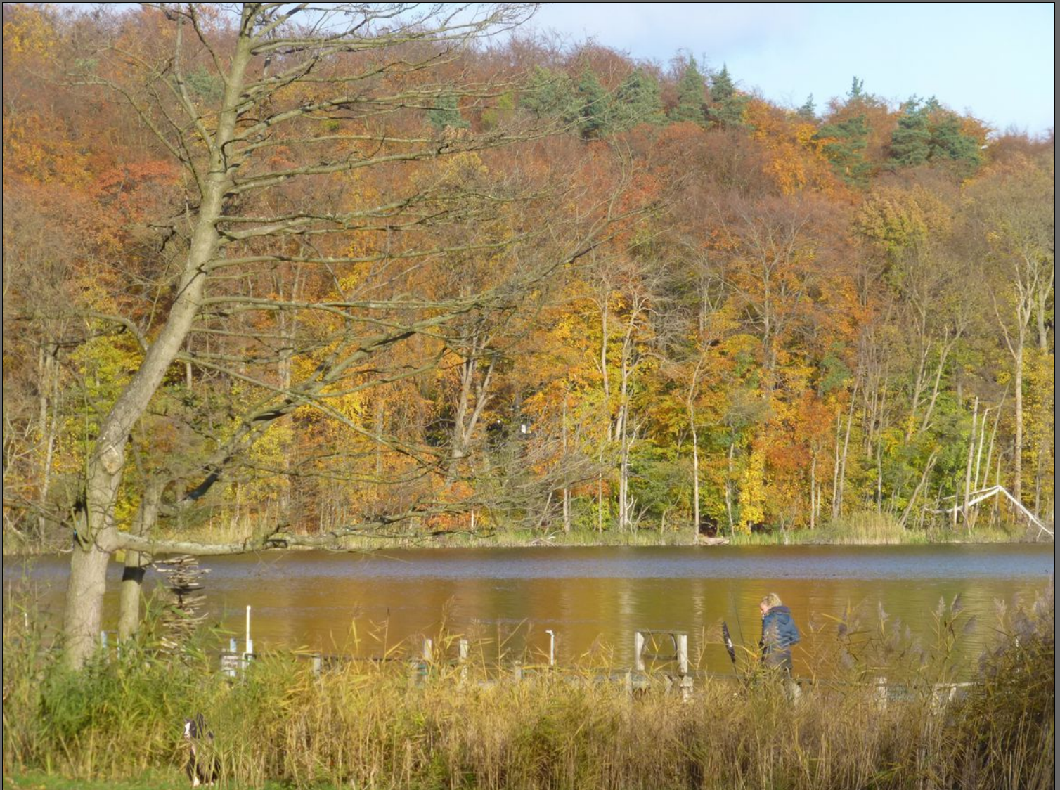
Herbstwald am Wolgastsee

Man lebt ruhiger, wenn man nicht alles sagt, was man weiss, nicht alles glaubt, was man hört und über den Rest einfach nur lächelt.