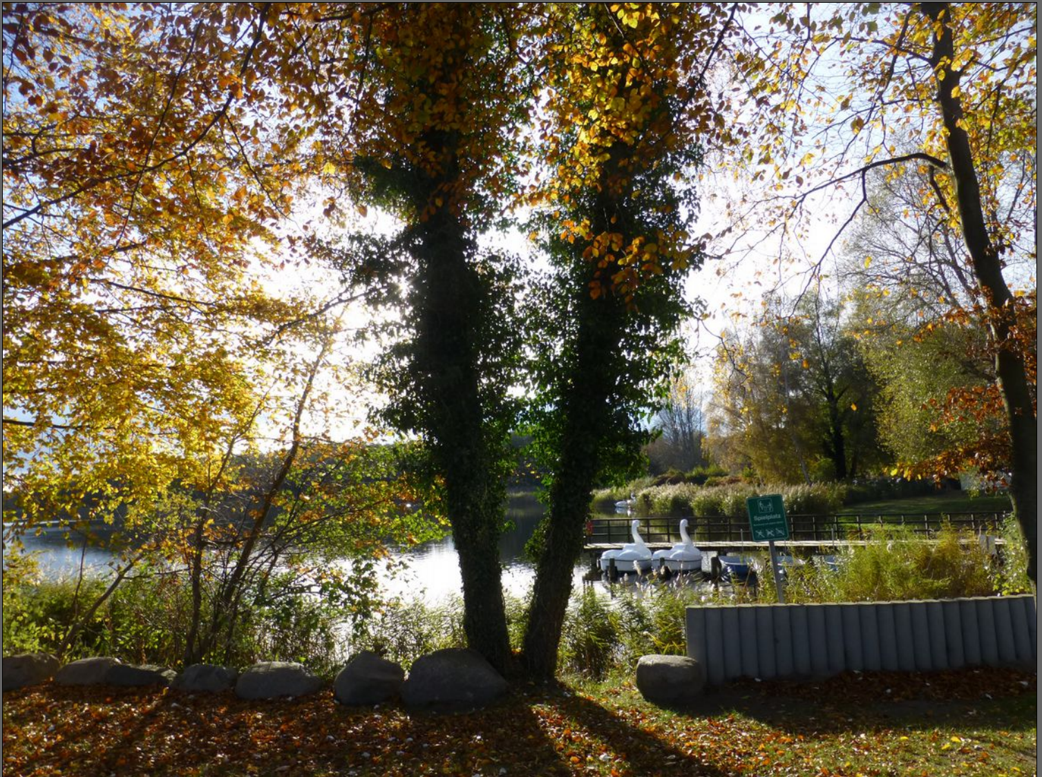
Herbst am Kölpinsee

Der eine sieht nur Bäume, Probleme dicht an dicht. Der andre Zwischenräume und das Licht.