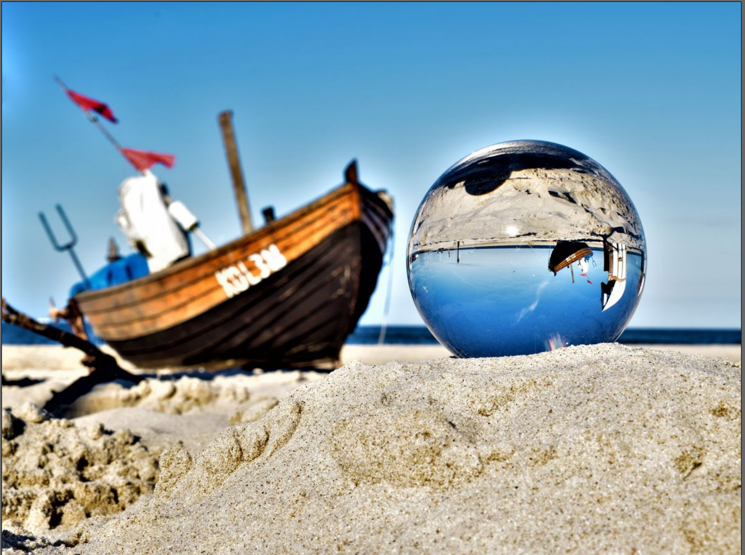
Boot am Strand von Kölpinsee

Ein Freund ist ein Mensch, der die Melodie deines Herzens kennt und sie dir vorspielt, wenn du sie vergessen hast.