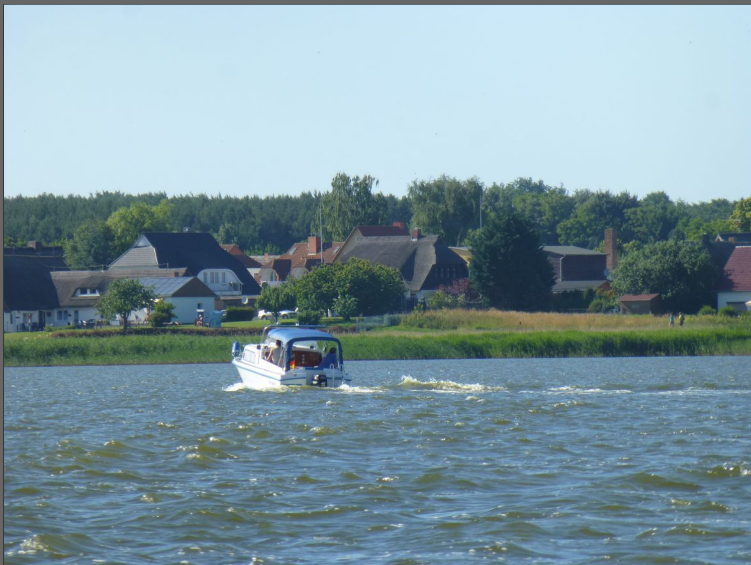
Zempin am Achterwasser

Ein Optimist ist ein Mensch, der alles halb so schlimm oder doppelt so gut findet.