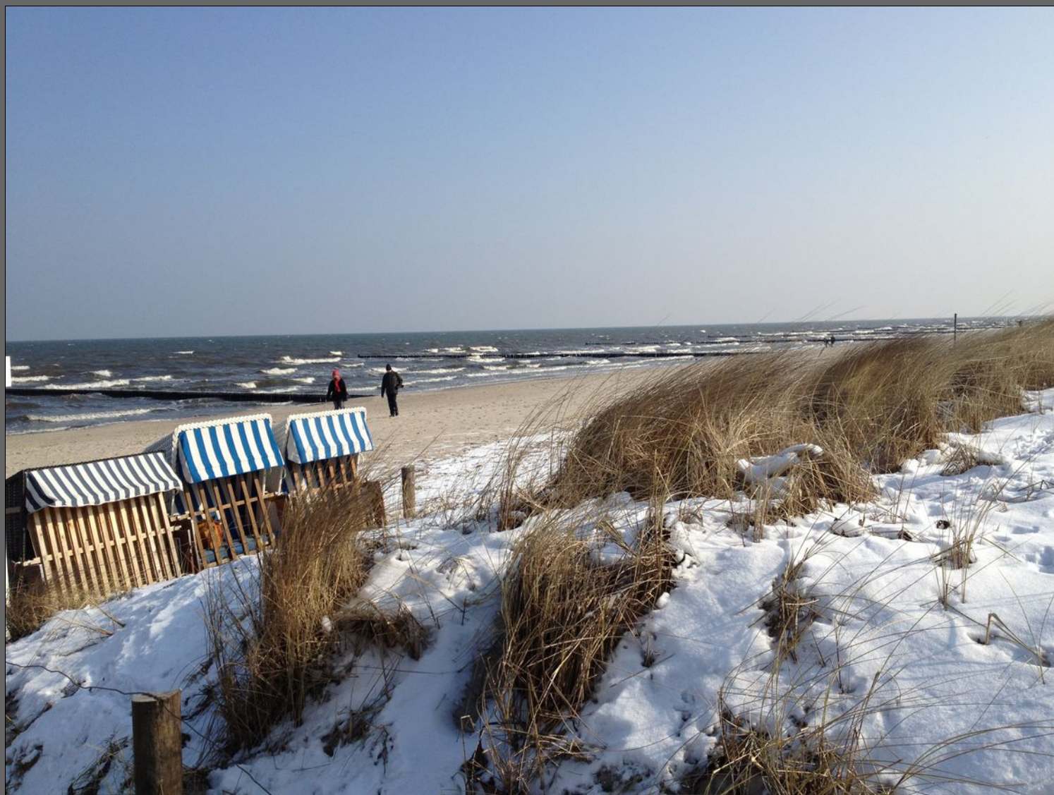
Winterstrand von Kölpinsee

Wir denken selten an das, was wir haben, aber immer an das, was uns fehlt.