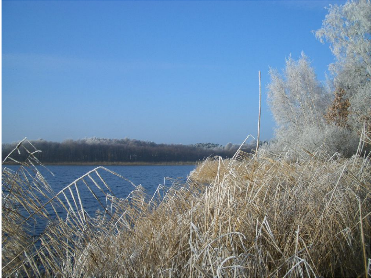
Der Kölpinsee – Namensgeber des Seebades.