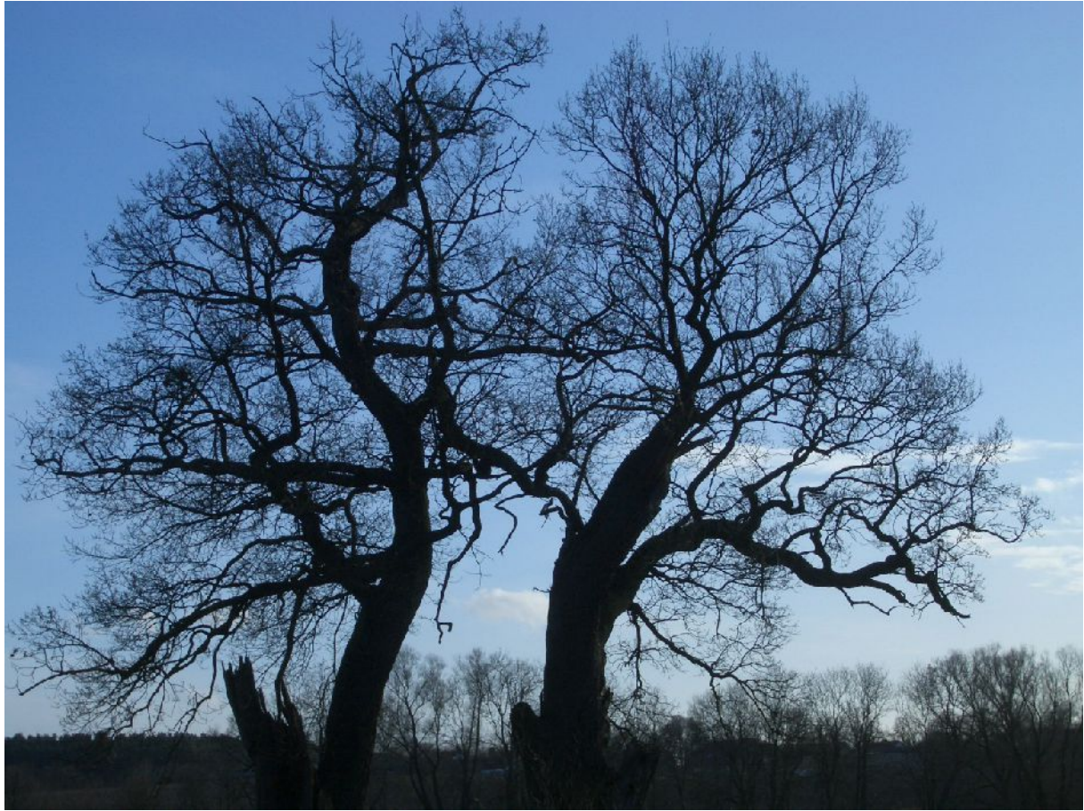
Winterlandschaft bei Mellenthin.