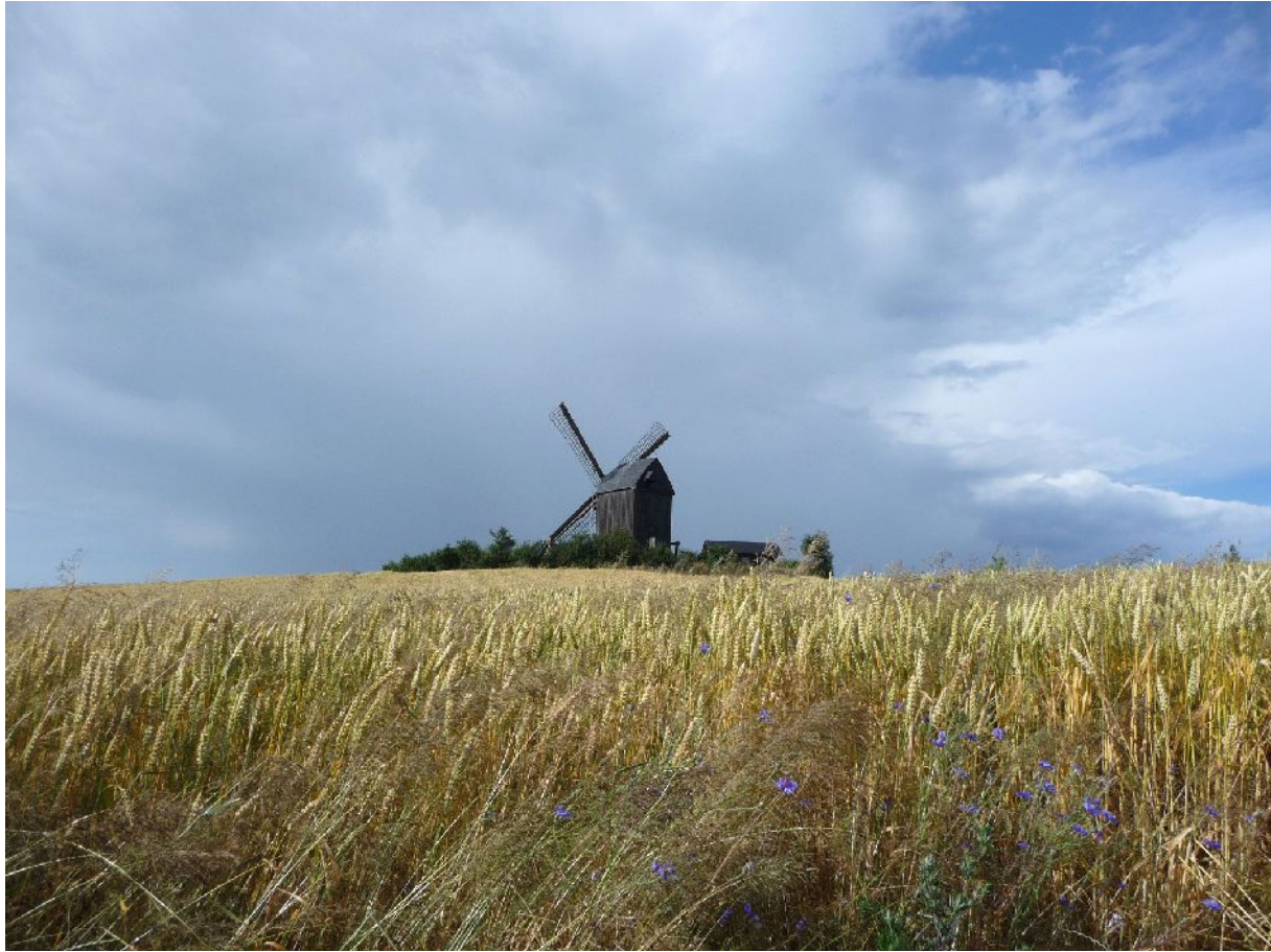
Bockwindmühle bei Pudagla.