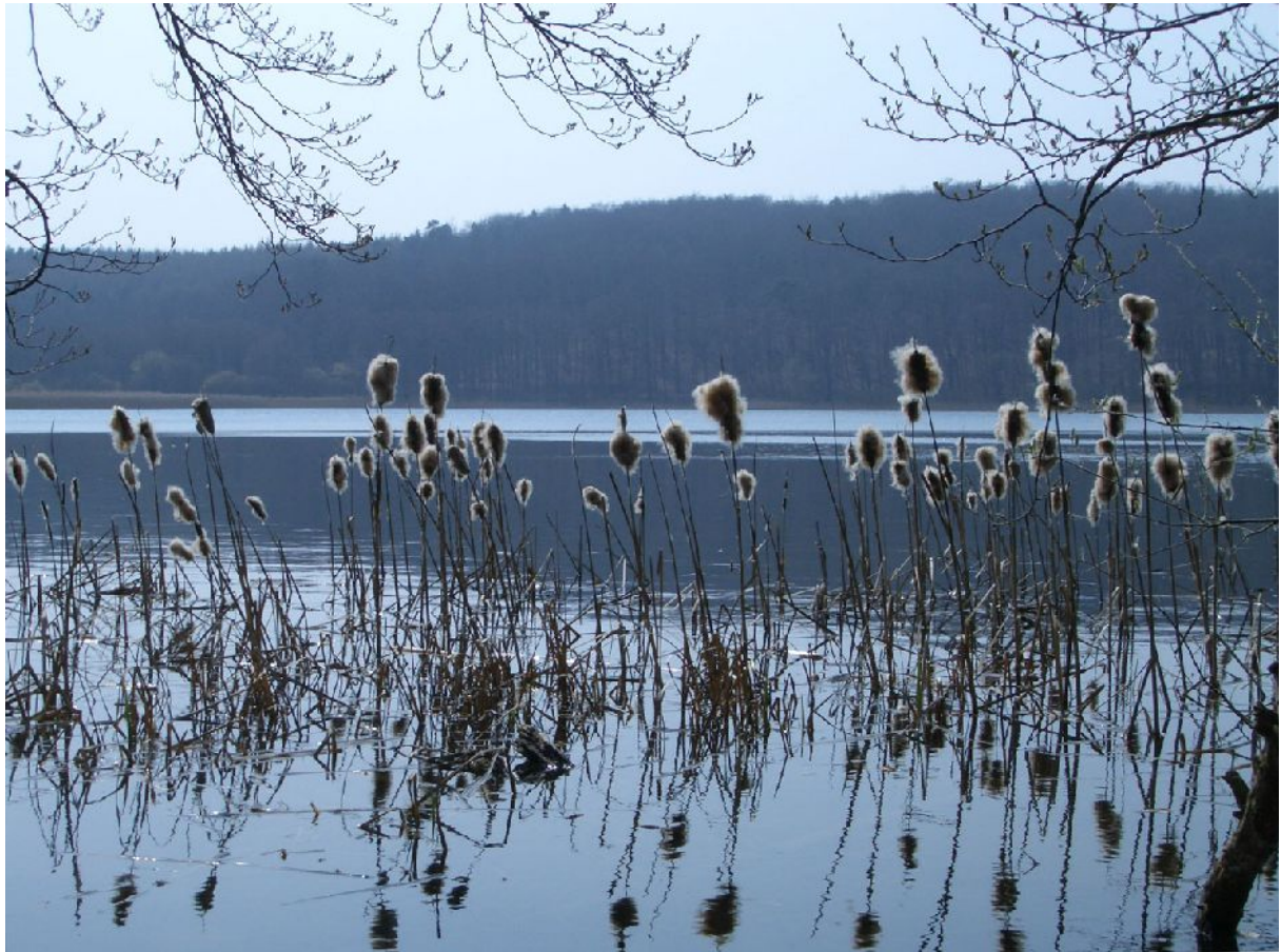
Wolgastsee bei Korswandt.