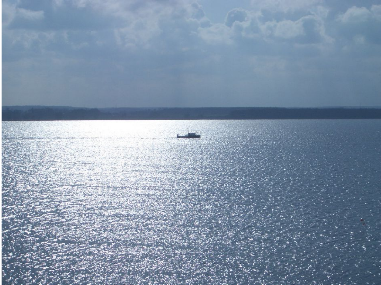
Der Peenestrom an der Halbinsel Gnitz.