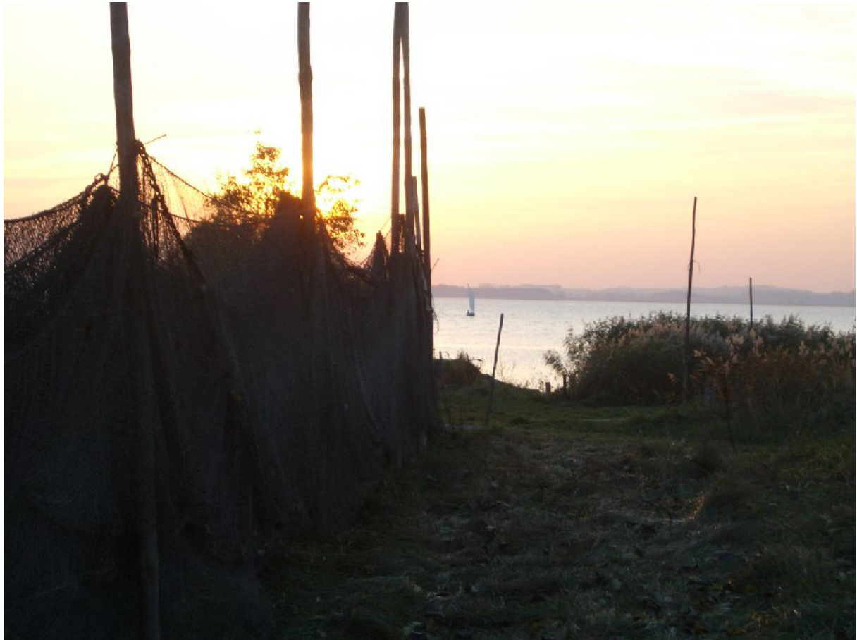
Netztrocknen am Peenestrom auf dem Lieper Winkel.