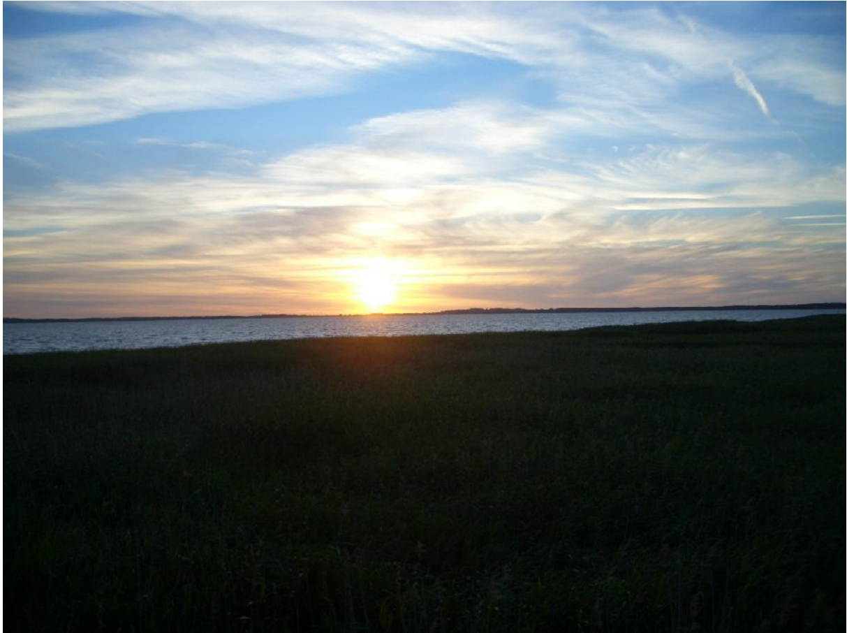
Sonnenuntergang über dem Achterwasser.