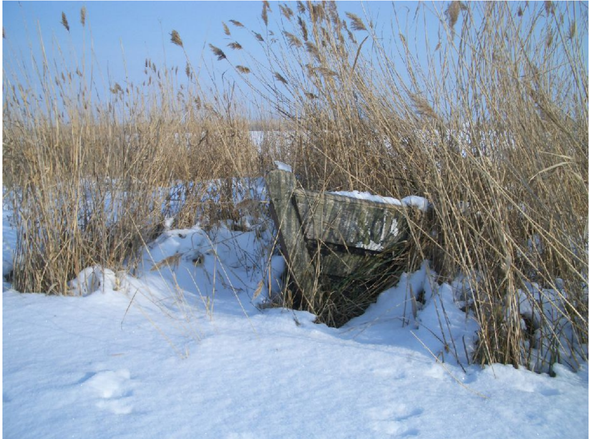
Fischerboot an der Melle, einem Arm des Achterwassers.