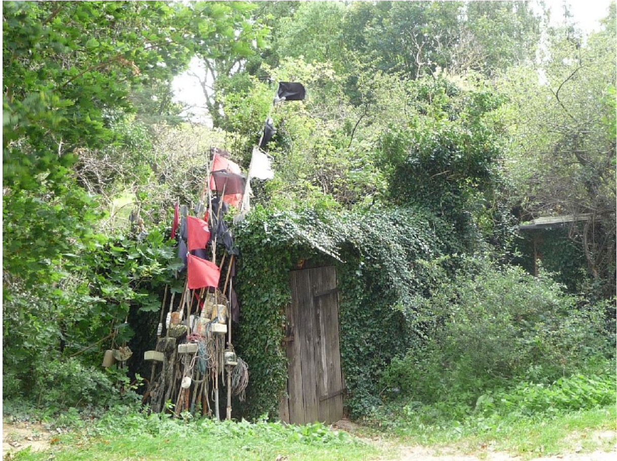
Fischerhütte in Stubbenfelde.