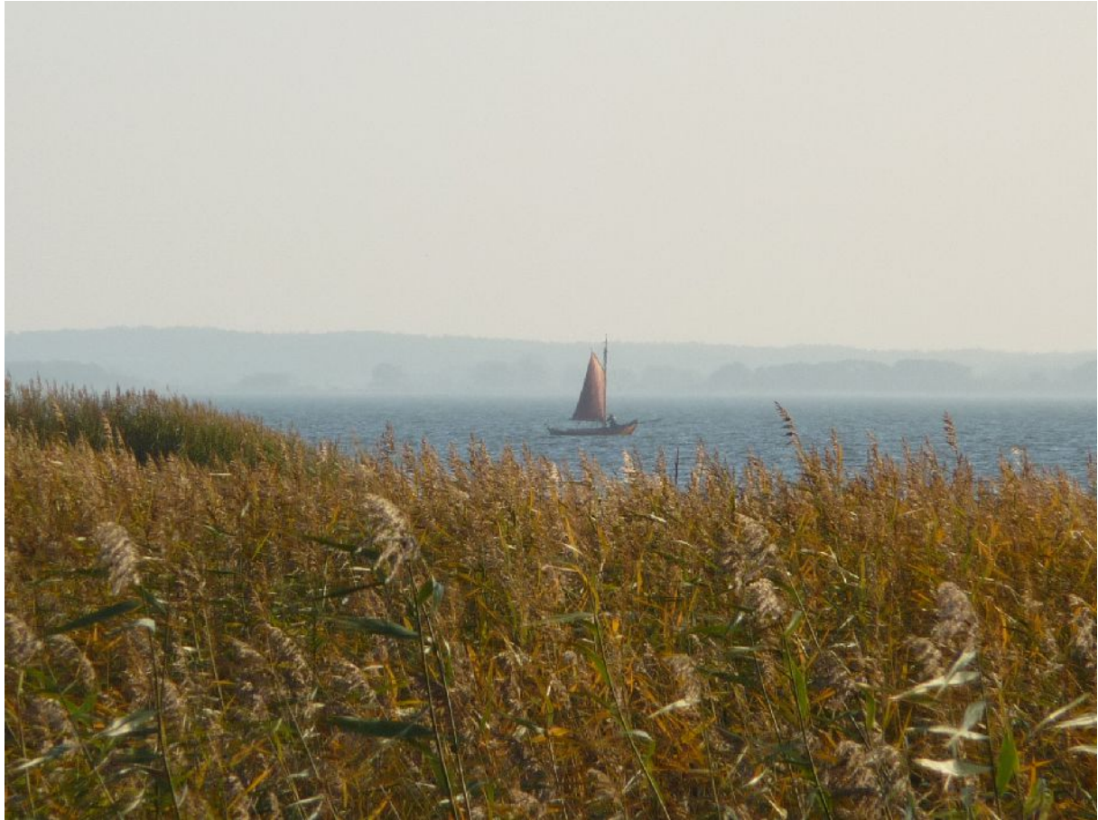
Segelboot auf dem Achterwasser.