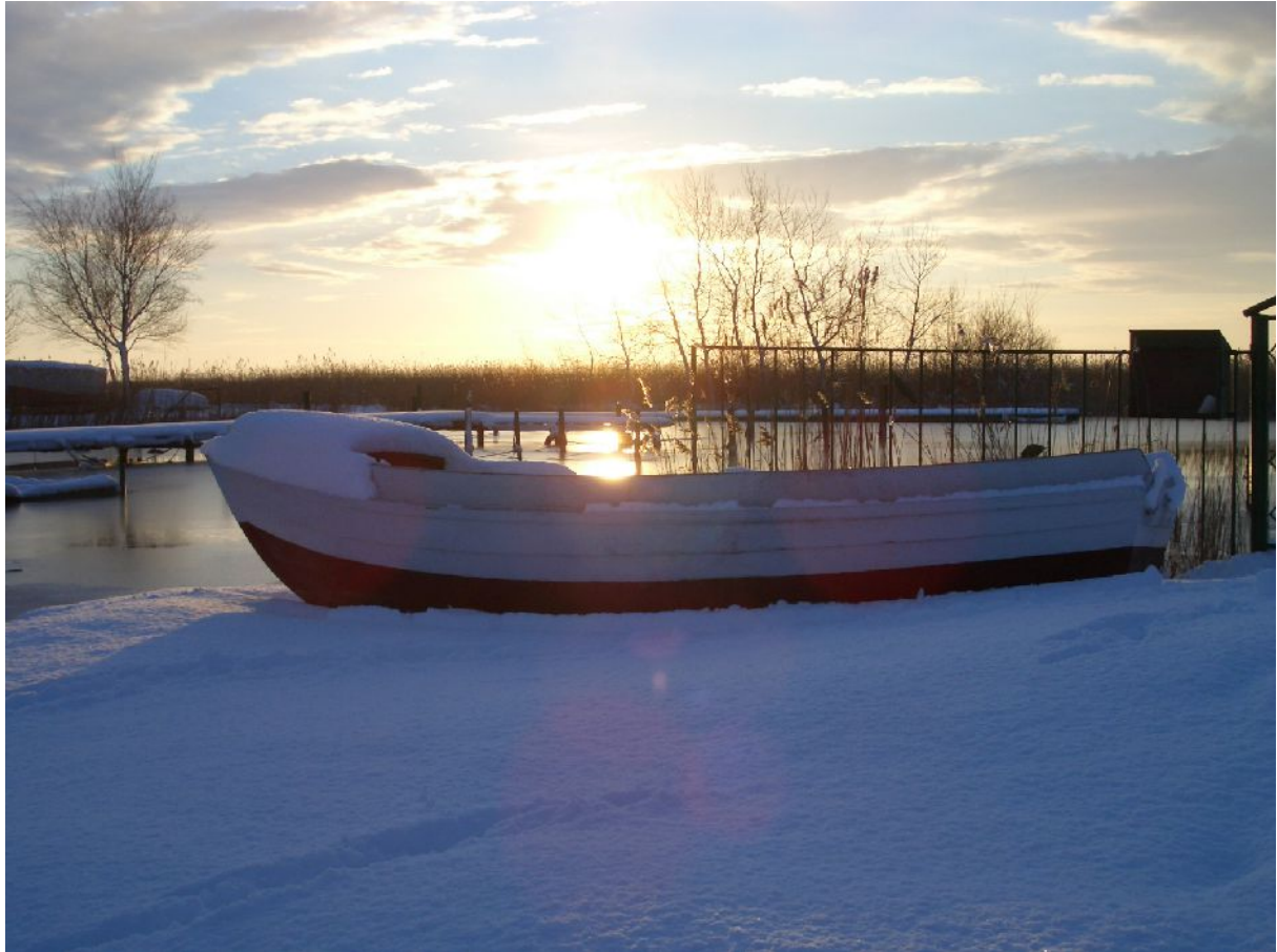
Achterwasserhafen von Loddin.